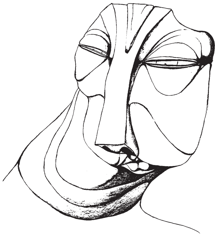
Figure 25: le beau Serge