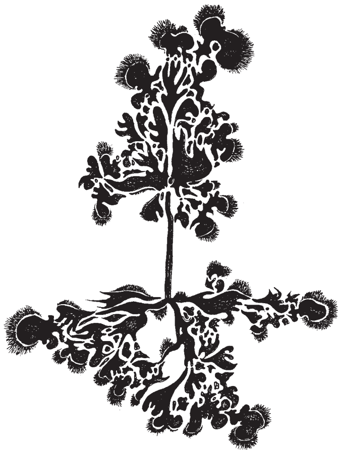
Figure 21: l'âme des poètes