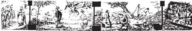
Figure 12: élégie