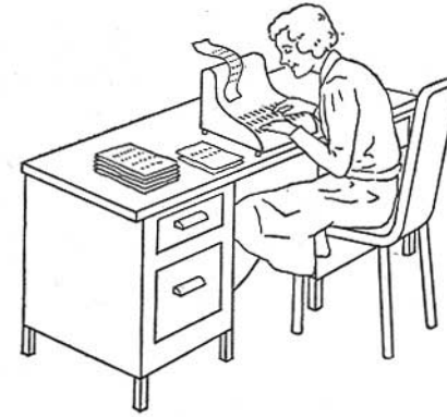
a) La calculatrice « de bureau »